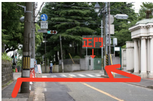
⑨「雙葉小学校入口」の信号。右手奥が正門です。