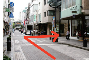
③元町商店街を 400m ほど進み、代官坂通りを右へ。