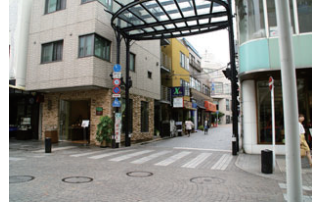
④代官坂通りへの曲がり角の様子。