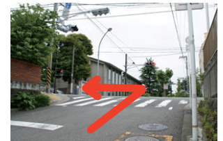
⑧「代官坂上」の信号を左へ。