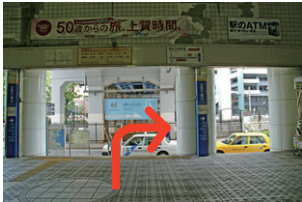
①元町口（南口）の改札を出て右。元町方面へ。