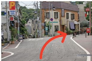
⑤代官坂に向かって右方向に進みます。