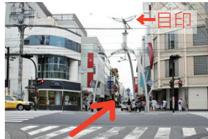
②「元町」の交差点。信号を渡り元町商店街を直進します。