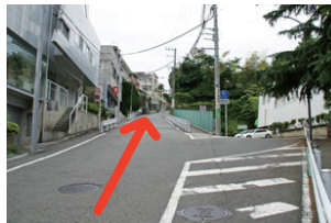
⑦直進して坂を上ってください。